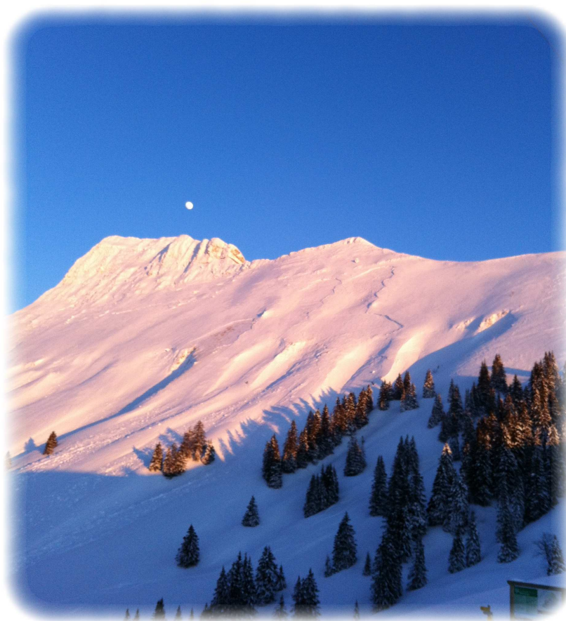
Dent de Lys enneigée

Administration communale Avenue de la Gare 33 1618 Châtel-St-Denis www.chatel-st-denis.ch